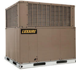
PHE6 (CALEFACCIÓN ELÉCTRICA) PHG6 (CALEFACCIÓN DE GAS)

Solamente región del norte de los Estados Unidos