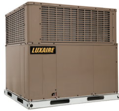
PCE6 (CALEFACCIÓN ELÉCTRICA) PCG6 (CALEFACCIÓN DE GAS)

Todas las regiones de los Estados Unidos