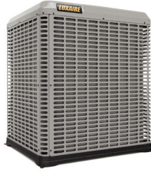
THF2 HL19 HL20 $S $$$$