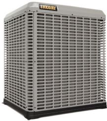
TCF2 AL19 AL21 $S $$$$